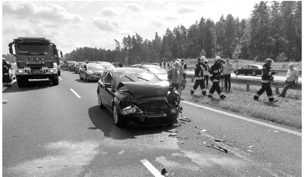
Wypadek samochodowy na drodze S7 w miejscowości Gibała (15.08.2022)

niku ul. Szkolna. Na miejscu osoba w stanie upojenia alkoholowego. Obudzono, rozpytano. Samodzielnie wstała i oddaliła się do miejsca zamieszkania.