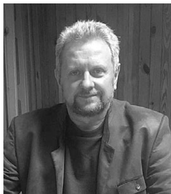
Jerzy Głowacz

Gratulujemy nowemu przewodniczącemu wyboru, życząc po-