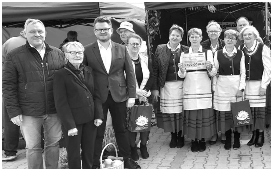
Koło Gospodyń Wiejskich z Mierek zajęło I miejsce w Konkursie na najlepszą potrawę i stoisko na Festiwalu