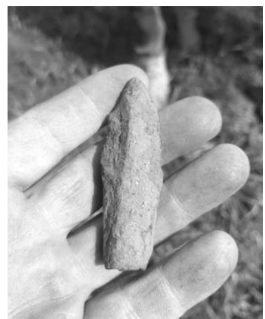
Płowce - grot od bełtu