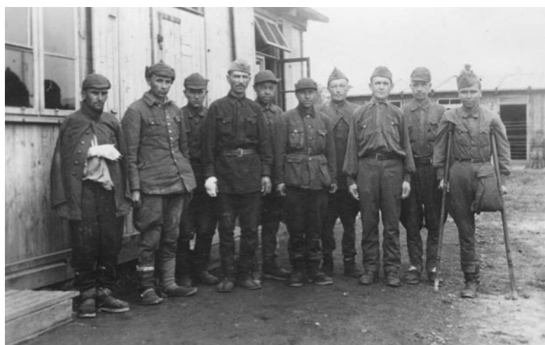
Grupa jeńców radzieckich - lato 1942