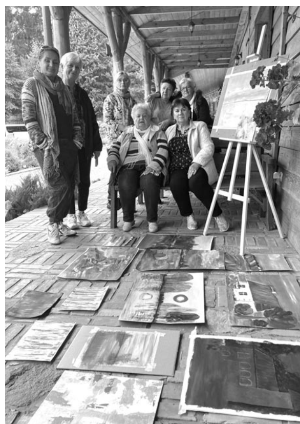
Plener malarski w urokliwym Raszażu