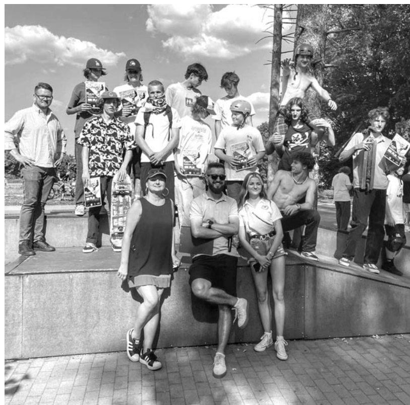
Zawody Extreme Jam 2022

18 września - W zaułku gotyckim przy Domu Mrongowiusza odbył się poruszający spektakl pt. „Eksperyment” (reż. P. Jankowski) w ramach projektu TEART POLSKI . Dziękujemy MBL SKANSEN oraz ZS im. K.C. Mrongowiusza za użyczenie terenu oraz garderoby.