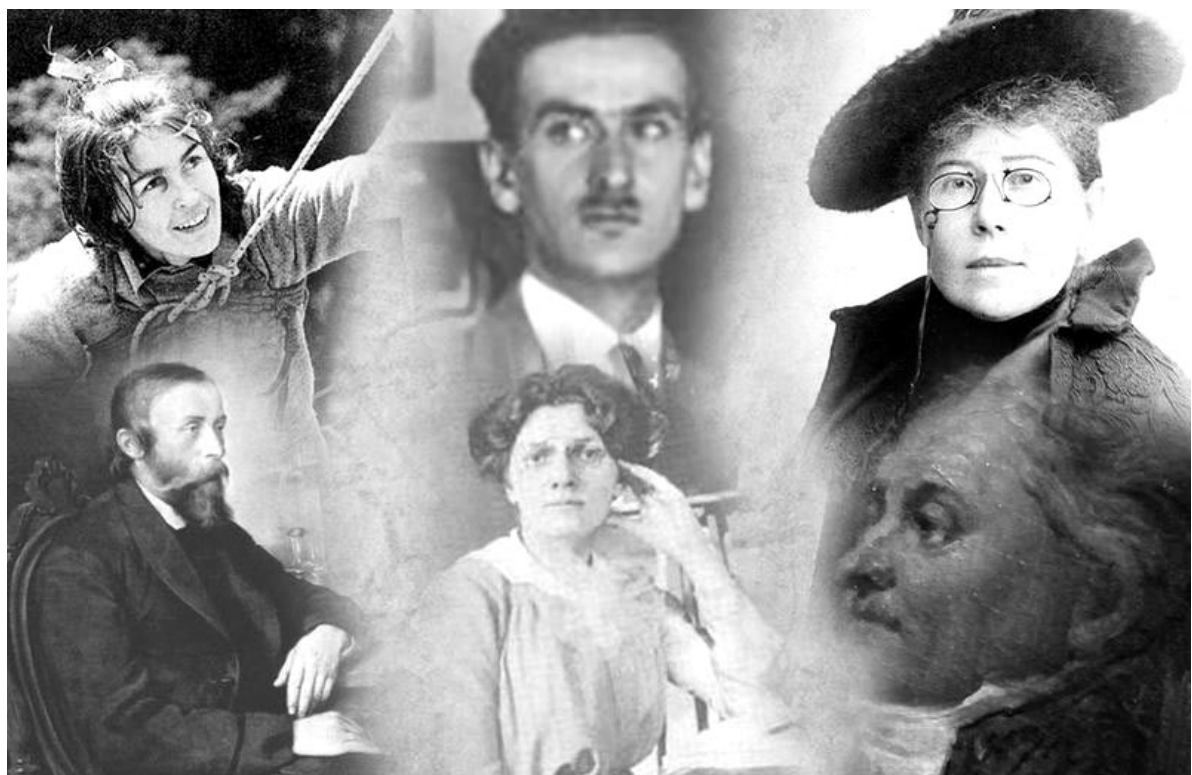
Patroni roku 2022 - Maria Grzegorzewska, Maria Konopnicka, Ignacy Łukasiewicz, Józef Mackiewicz, Wanda Rutkiewicz, Józef Wybicki

Maria Konopnicka, z domu Wasilowska, urodziła się 23 maja 1842 roku w Suwałkach, zmarła 8 października 1910 roku we Lwowie. Teksty Jej wzbudzały kontrowersje, polemiki, a nawet ostre krytyki. Jednak w swoich czasach była szalenie popularna i czytana przez wszystkich. Przebijała się do literatury o własnych siłach. Była nie tylko pisarką, lecz i działaczką społeczną.