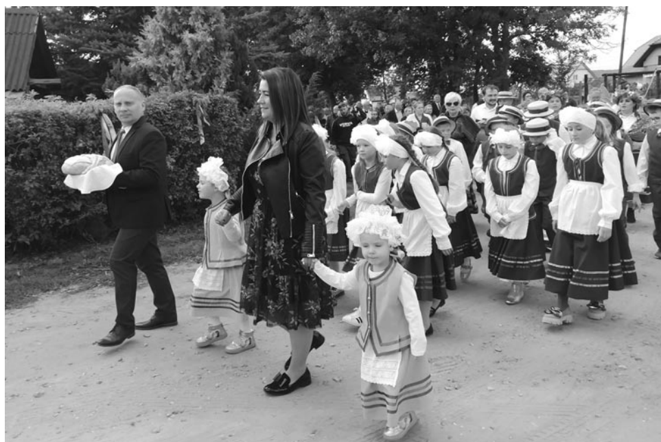
Dożynkowy korowód - Olsztyneckie Dożynki Gminne w Mierkach