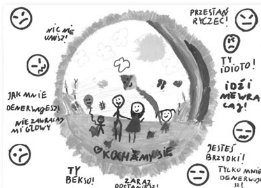
rys. Alicja Sobierajska