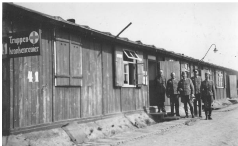
Grupa jeńców radzieckich - lato 1942

z obozu jenieckiego Stalag IB. Zdję- cia wykonał oficer niemiecki, który należał do komendatury obozu i był prawdopodobnie funkcyj- nariuszem politycznym SD. W albumie zachowało się 137 czarno-białych zdjęć dobrej jakości. Pierwsza część dotyczy obozu Stalag IB i obejmuje 58 zdjęć zrobionych w latach 1941-1943. Są to unikalne fotografie. Przedstawiają wygląd obozu jenieck- iego z barakami mieszkalnymi, grupy jeńców w różnych sytuacjach, izbę chorych z wyposażeniem, koncert orkiestry obozowej, występ teatru obozowego. Dużo zdjęć uka-