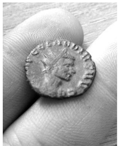
Płowce - rzymska moneta