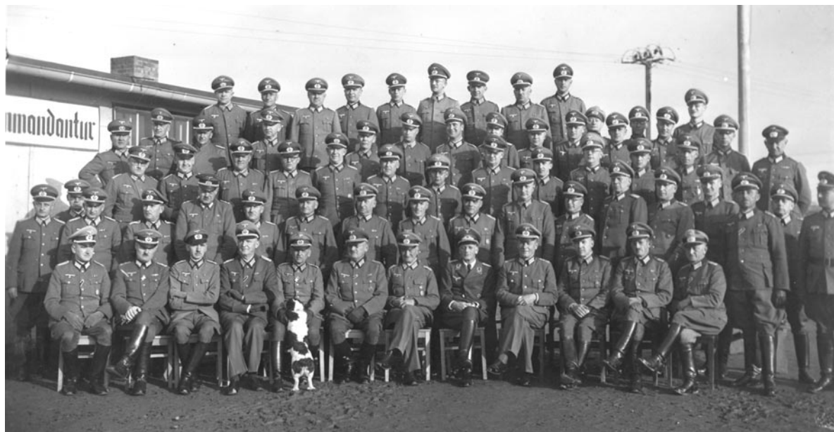
Oficerowie komendatury obozu Stalag IB (14.10.1941r.)

Kilka tygodni temu całkiem przy- padkowo zakupił na aukcji internetowej niezwykle wartościowy al- bum zawierający oryginalne zdjęcia