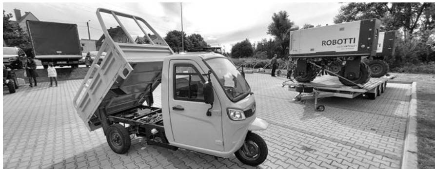
Wydarzeniu towarzyszyła wystawa sprzętu rolniczego