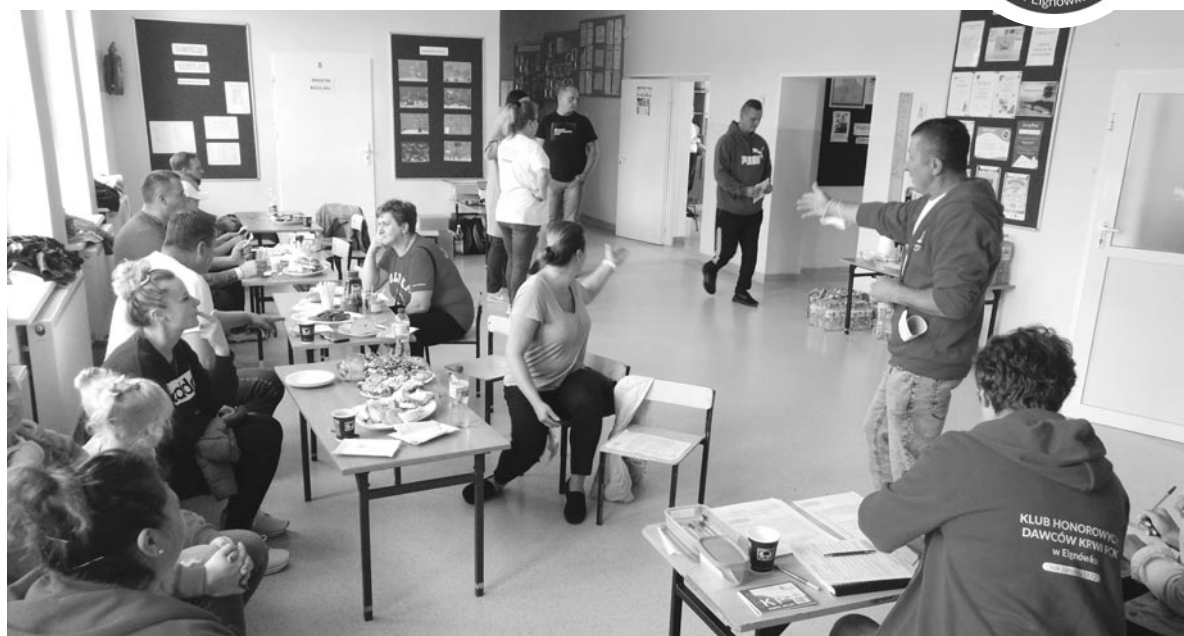
fol. Klub HDK Elgnówko

W bieżącym roku odbędzie się jeszcze jedna akcja poboru krwi, jak