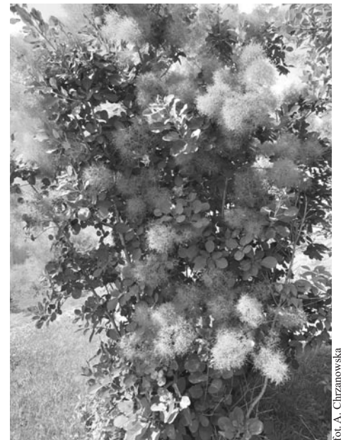
for. A. Chrzanowska

Dopiero jesień wrześniową porą zapowiadana kwietny puch PERUKOWCA po wrzosowych polanach rozniesie