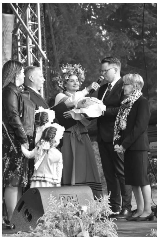
Olsztyneckie Dożynki Gminne