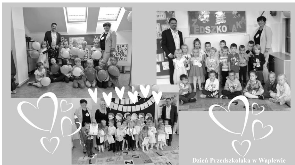
Dzień Przedszkolaka w Waplewie

20 września – to dzień ważny dla wszystkich przedszkolaków w całej Polsce. Święto to zostało ustanowione, by podkreślić wagę edukacji przedszkolnej w rozwoju i edukacji dzieci. Tego dnia na nasze pociechy czekało wiele niespodzianek i atrakcji. Wśród nich znalazły się między innymi gry i zabawy integra-