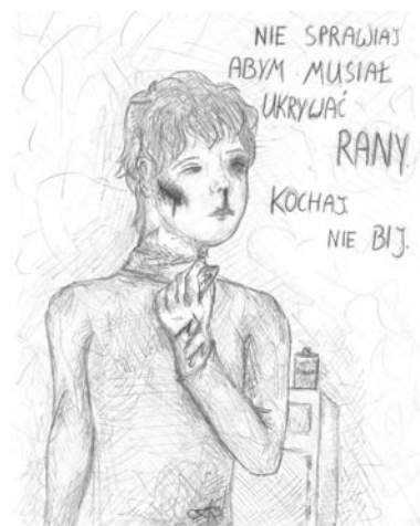
rys. Dagmara Karwowska

W trakcie spotkania przedstawiono założenia projektu, dotychczasowe działania oraz zadania do zrealizowania do końca projektu.