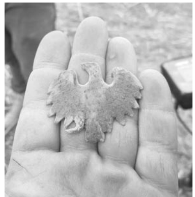
Grunwald - Orzeł Ludowego Wojska Polskiego - kurica