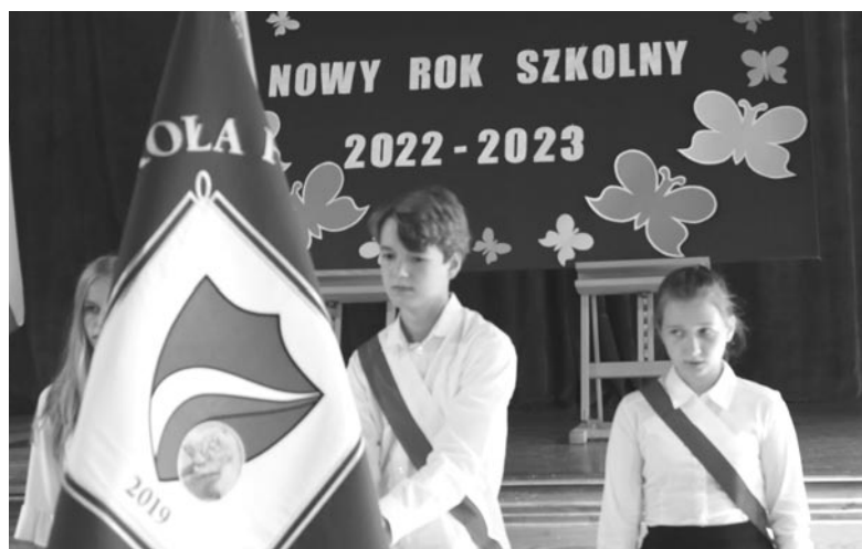
fol. UM Olsztyniek

Obecnie na terenie naszej gminy funkcjonują 3 szkoły średnie (są to należące do Zespołu Szkół im. K.C.