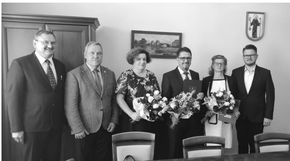
fol. UM Olsztyniek