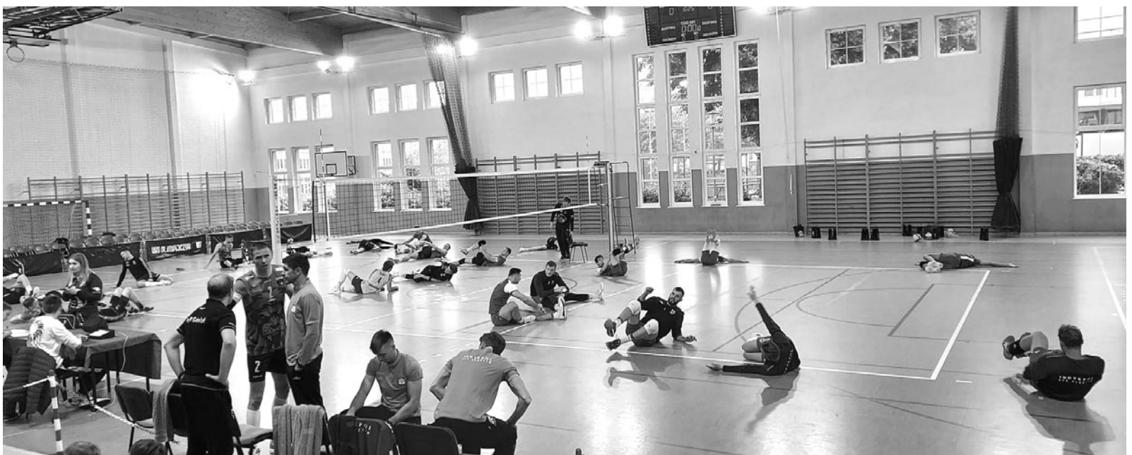
Zawodnicy Indykpol AZS Olsztyn i Trefl Gdańsk w trakcie rozgrzewki

W piątkowe popołudnie 9 września oraz następnego dnia, w sobotę, w hali sportowej Szkoły Podstawowej nr 1 im. Noblistów Polskich odbyły się 2 mecze sparingowe drużyn piłki siatkowej PlusLigi: Indykpol