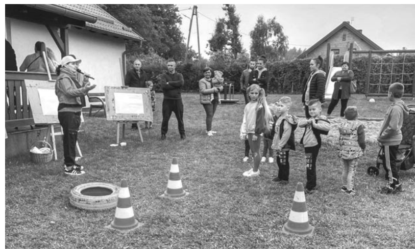
Festyn wiejski w Drwęcku