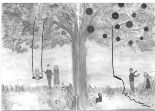
rys. Iga Chwedorczyk