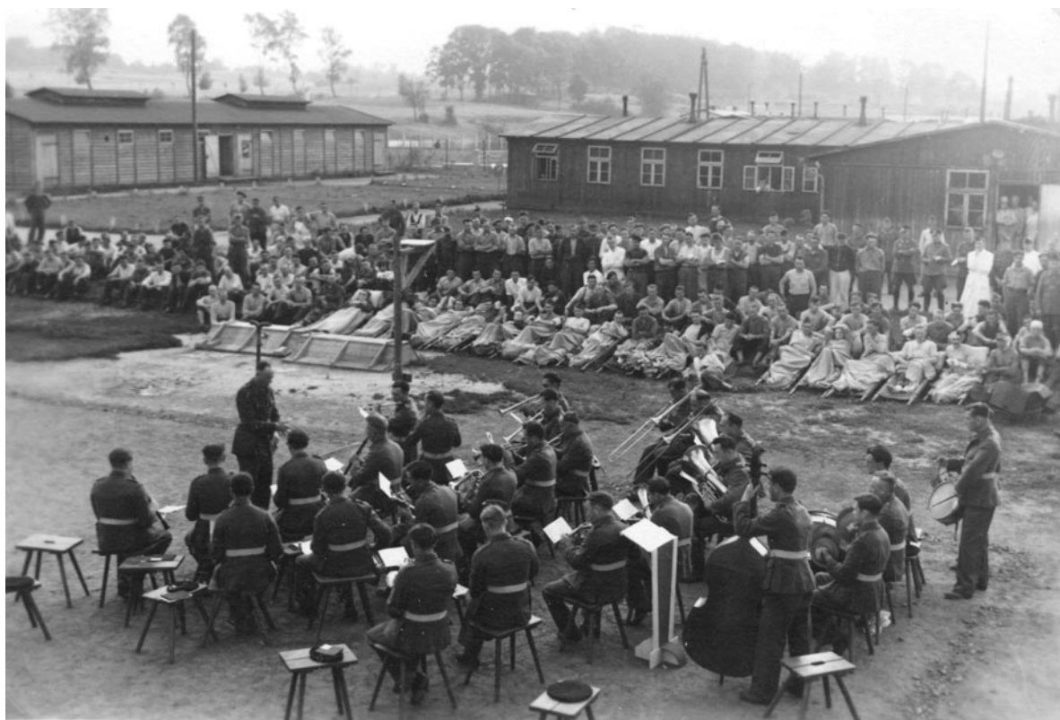
Koncert orkiestry obozowej (15.05.1942r.)

Muzeum miejskie mogło odegrać ważną rolę w promocji Olsztyńka na skalę europejską. Planowano utworzenie archiwum oraz centralnej bazy danych dotyczących jeńców wojennych więzionych w obozie Stalag IB. Takie materiały istnieją w różnych europejskich instytucjach i można je zgromadzić i opracować. Niestety nie było siły sprawczej i działalność muzeum ograniczyła się jedynie do oprowadzania zwiedzających. W muzeum zgromadzono kilka tysięcy eksponatów pozyskanych w trakcie badań ar-