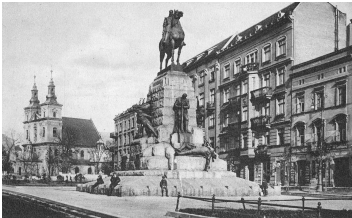
Pomnik grunwaldzki na pocztówce sprzed II wojny światowej

Maria Konopnicka została poznana jako obrończyni ludu polskiego. Była przez współczesnych kolegów po piórze uznawana za poetkę społeczną. Na 25-lecie pracy pisarskiej, w 1903 roku, Konopnicka otrzymała w darze „od narodu” dworek w Żarnowcu koło Krosna na Pogórze Karpackim.