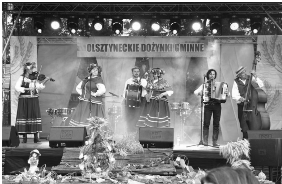
Kapela Śparogi - Olsztyneckie Dożynki Gminne w Mierkach