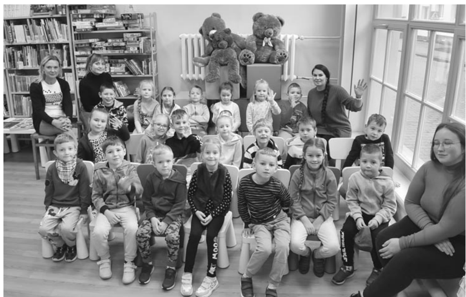
fol. MBP Olsztynek

Spotkanie rozpoczęło się od ogłoszenia wyników Konkursu Fotograficznego ogłoszonego przez Miejską Bibliotekę Publiczną w Olsztynku. Zadaniem konkursowym było wykonanie fotografii nawiązującej do „Bal-