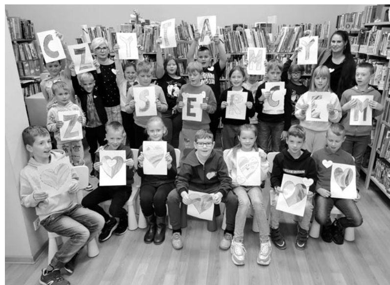
Spotkania w ramach akcji „Czytamy z sercem” - na zdjęciu klasa III ze Szkoły Podstawowej nr

Każdy z uczestników spotkania mógł również zabrać na pamiątkę folder dotyczący wystawy przygotowany specjalnie na tę okazję.