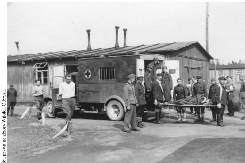
Grupa jeńców radzieckich i wachmani przed izbą chorych - lato 1942