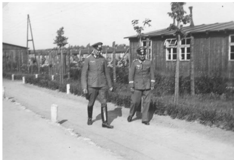
Oficerowie niemieccy na obozowej drodze - lato 1942