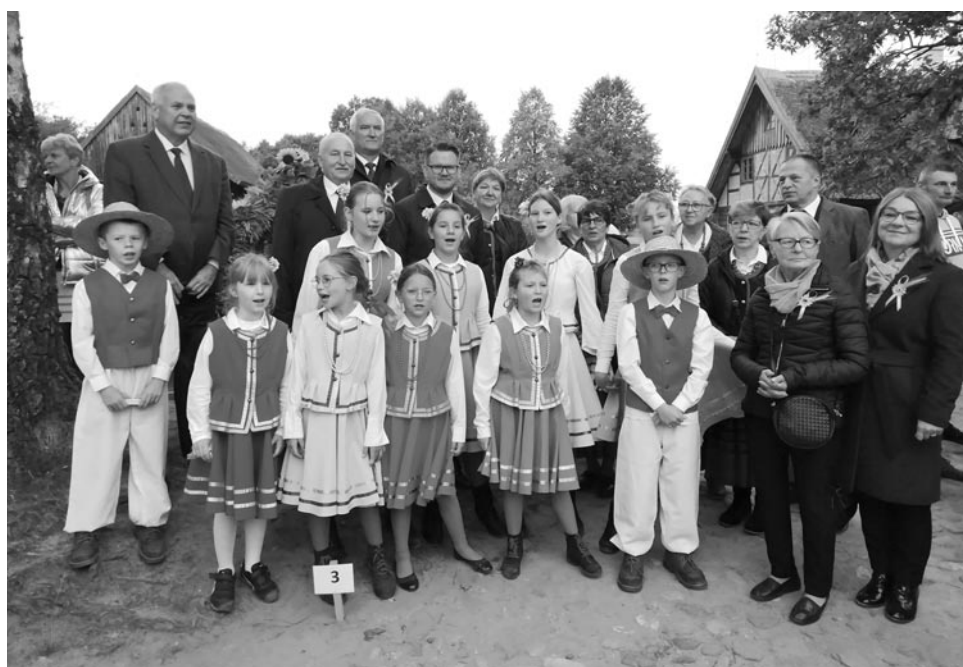
Reprezentacja naszej gminy - Warmińsko-Mazurskie Dożynki Wojewódzkie