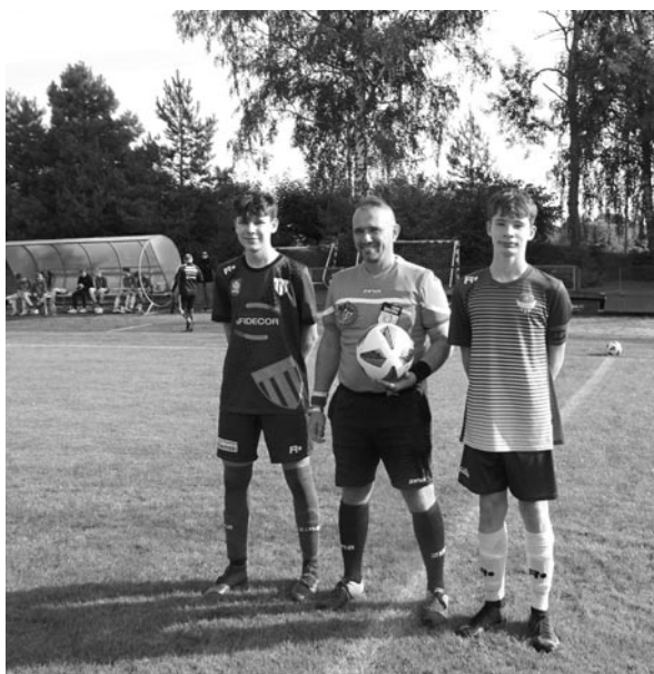
Zdjęcie z meczu drużyny Juniora Młodszego z Olimpią Kisielice, wygranego przez nasz zespół 12:1

Najmłodsze drużyny Olimpii od września rozpoczęły zmagania ligowe. Drużyny Skrzatów, Żaków i Orlików grają turnieje WMZPN organizowane w Olsztynku i pobliskich miejscowościach.