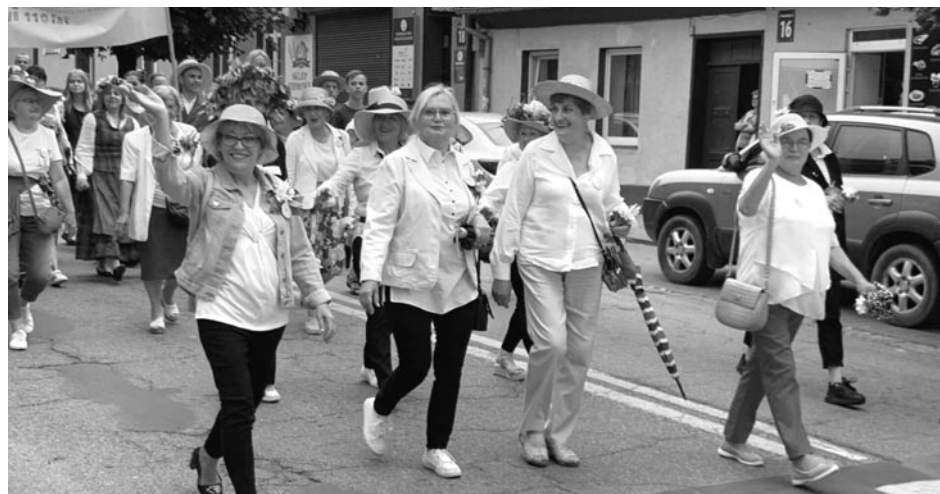
Sluchacze UTW podczas parady Dni Olsztynka

Na zakończenie, pod kierunkiem prowadzącej, wykonaliśmy krem z glistnika