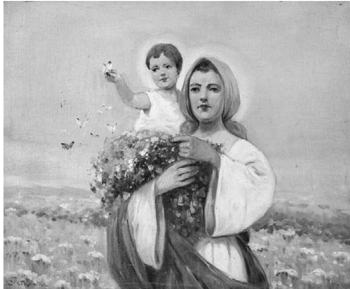
Matka Boska Zielna, Adam Setkowicz, 1930

Święcono nie tylko zboża, warzywa, ale również zioła. W zależności od regionu zbierano różne rośliny. Bukiety były bardzo duże, ponieważ starano się włożyć w nie rośliny ze wszystkich sfer