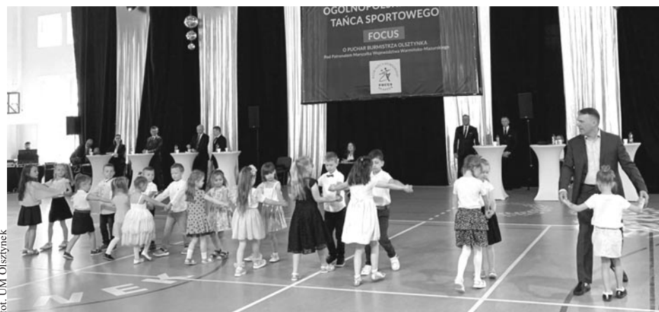
fol. UM Olsztyniek

10 czerwca pary taneczne zaprezentowały swoje umiejętności i pasje na parkiecie w hali sportowej Szkoły Podstawowej nr 1 im. Noblistów Polskich. Różnorodność stylów i kategorii sprawiła, że każdy mógł znaleźć coś dla siebie, niezależnie od preferencji tanecznych. Turniej został zorganizowany pod Honorowym Patronatem