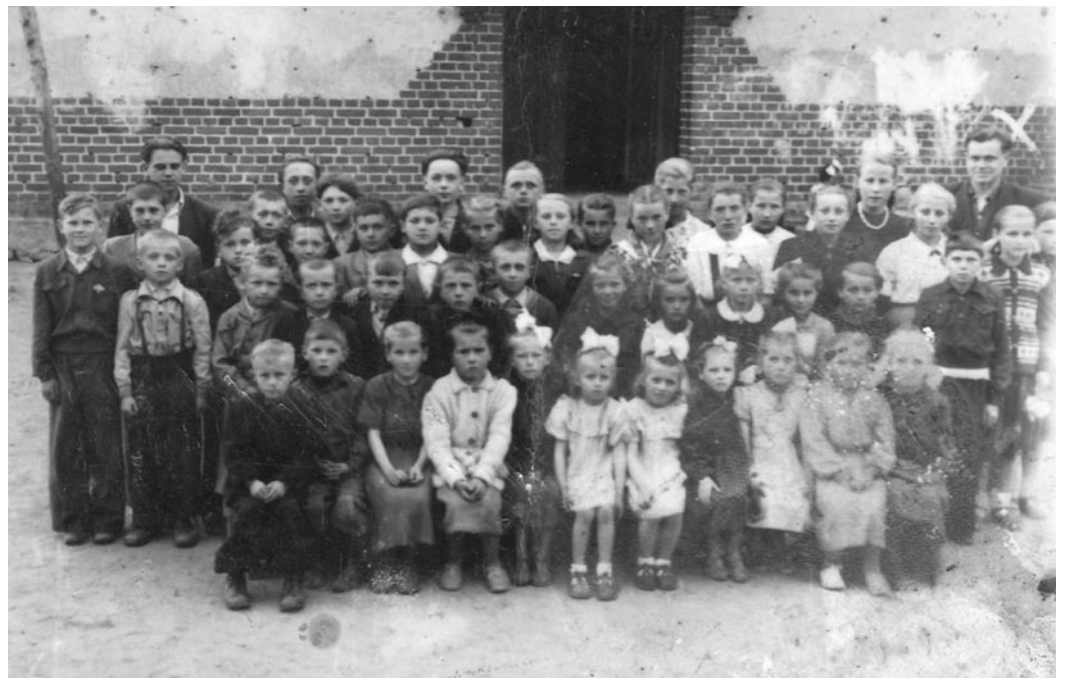
Dzieci ze szkoły podstawowej w Wopach 1956 r.