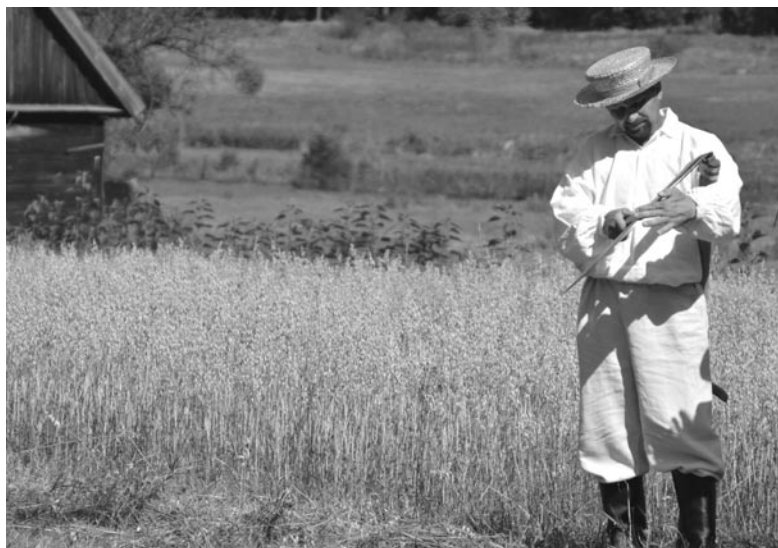
fol. MBL-PE w Olsztynku

W czasie żniw wstawano o wschodzie słońca. Ubierano się w czyste, lniane koszule i spodnie. Zakładano kapelusze (mężczyźni) i chusty (kobiety), a dziewczęta przystrajały włosy kwiatami. W pole wychodzono