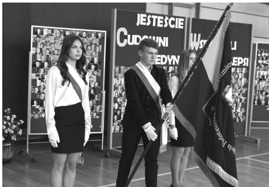
Salę gimnastyczną podczas apelu ozdobiły zdjęcia KAŻDEGO ucznia

Paryż zachwycał licznymi zabytkami, wielokulturowością, różnorodnością i spowodował, że niektórzy uczestnicy postanowili w przyszłości tu wrócić. Ale nie tylko zagranicą urzekła naszych uczniów. Liczne szkolne wycieczki, m. in. do Lublina, Zamościa, Warszawy, Fromborka, Krynicy Morskiej to okazje do poznania nowych regionów, ich kultury, zabytków. A co najważniejsze – to najlepsza okazja do integracji zespołów klaso-