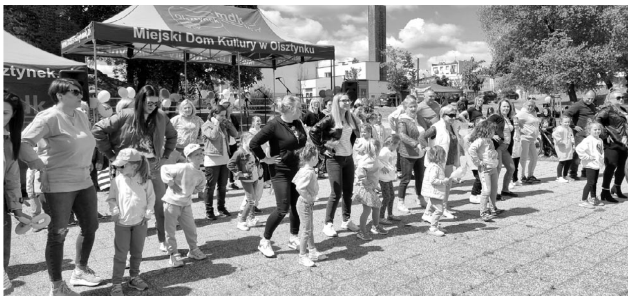
fol. MOPS Olsztynek

Rozpoczęcie gminnych dni rodziny zainicjowały przedszkolaki z Przedszkola Miejskiego w Olsztynku, których dopingowali rodzice pod sceną. Kolejnym punktem programu był występ olsztyneckich perkusistów. Później uczniowie ze Szkoły Podstawowej nr 1 im. Noblistów Polskich w Olsztynku zauroczyli nas pięknym śpiewem i grą na gitarze. I przyszedł czas na występy Zespołów z Miejskiego Domu Kultury w Olsztynku Cool Kids, Bang Bang Crew, Tonacja, Marimba, Sing and Life, Miau, Pochodnia. Nie zabrakło oczywiście warsztatów perkusyjnych, jak