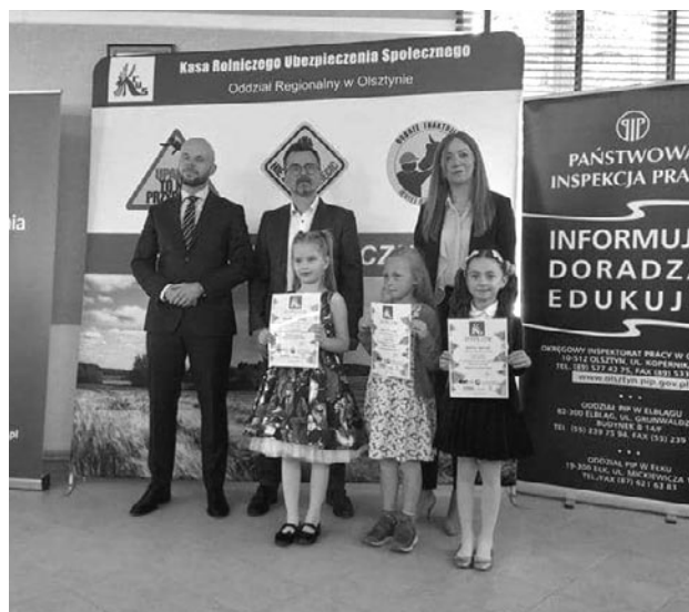
Weronika podczas wręczenia nagrody

W marcu tego roku Kasa Rolniczego Ubezpieczenia