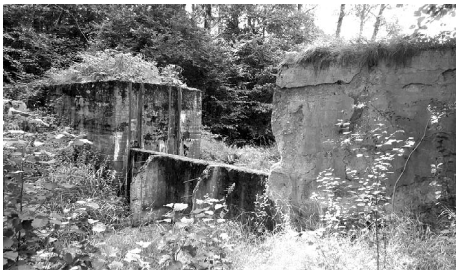
Tama systemu zalewowego w okolicy Miodówka

Zamknięty kanał o długości około 50 m ponownie otwiera się i biegnie leśną