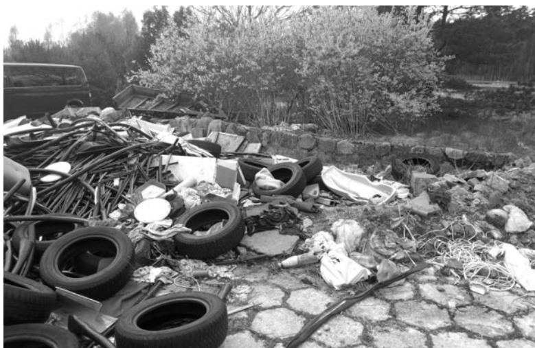
Nielegalne składowisko odpadów w okolicach Pawłowa

OPRAC. NA PODSTAWIE INFORMACJI STRAŻY MIEJSKIEJ W OLSZTYNKU