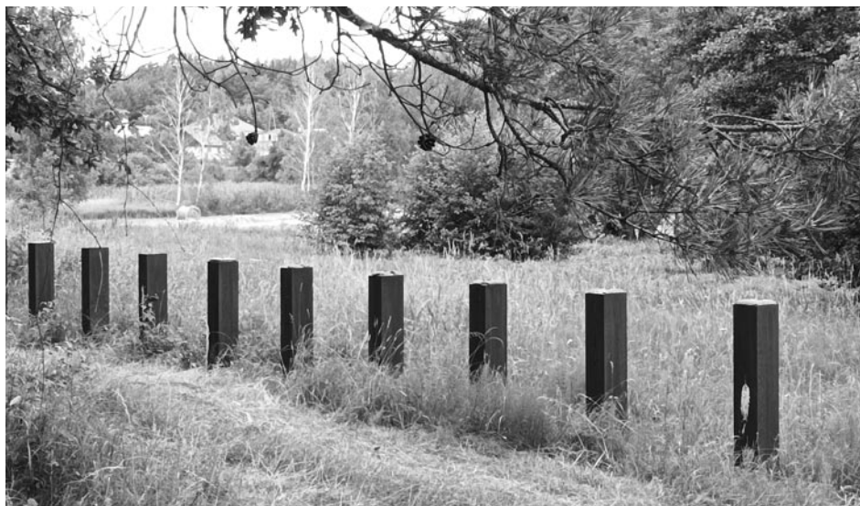
Zapora przeciwczołgowa w Bolejnach

W ramach zespołu fortyfikacji Pozycji Olsztyńskiej bardzo ciekawym i rzadko spotykanym elementem jest zapora przeciwczołgowa w miejscowości Bolejny. Wyróżnia się bardzo oryginalną strukturą, jak na niemieckie umocnienia budowane bezpośrednio przed II wojną światową, jak i w jej trakcie. Latem 1944 r. w Prusach Wschodnich, podobnie jak we wszystkich wschodnich prowincjach, rozpoczęto zakrojone na szeroką skalę roboty fortyfikacyjne. Najważniejsze były przeszkody przeciwczołgowe i właśnie one budowane były w pierwszej kolejności. Standardową przeszkodą był rów o profilu trójkątnym (szerokości ok. 5 m i głębokości ok. 2,5 m) poprowadzony najczęściej na zapole pozycji. W szerokim stopniu wykorzystywano również wszelkie naturalne przeszkody terenowe w postaci jezior, podmokłych łąk, bagien, strumyków i rzek. Właśnie w rejonie Bolejny mamy do czynienia z wszystkimi tymi przeszkodami. W najważniejszych miejscach stosowano również inne rodzaje przeszkód, wśród których wyróżnia się fragment sztucznej przeszkody o nietypowej w skali nie tylko Mazur, ale i całego kraju konstrukcji. Zapórę stanowi rząd stalowo-betonowych słupów (zespawane razem i wypełnione żelazobetonem ceownikami), ustawionych pionowo na betonowym fundamencie. Słupy wystają z fun-