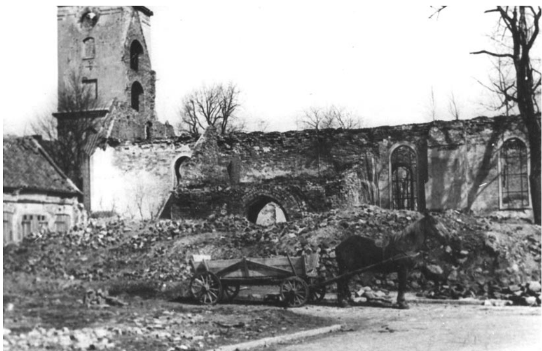
Ruiny kościoła ewangelickiego w centrum Olsztynka