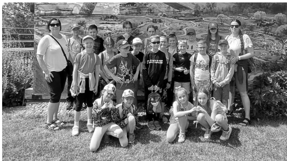
Wakacje z Biblioteką - I grupa

Na najmłodszych czytelników czekało wiele atrakcji. Każdego dnia byli zaskakiwani nowymi formami aktywności na terenie Zabytkowej Wieży Ciśnień (dziękujemy za współpracę Urzędowi Miejskiemu), biblioteki i w plenerze. Dzieci odwiedziły m.in. Wioskę Garncarską w Kamionce, w której poszerzały wiedzę o dawnych zwyczajach, budownictwie Warmii i Mazur oraz zamieniły się w poszukiwaczy skarbów w rajskim ogrodzie. Kolejnym punktem programu był wyjazd do parku Bartbo w Butrynach. Park linowy, wodne zjeżdżalnie i dmuchańce zrobiły ogromne wrażenie na naszych czytelnikach.