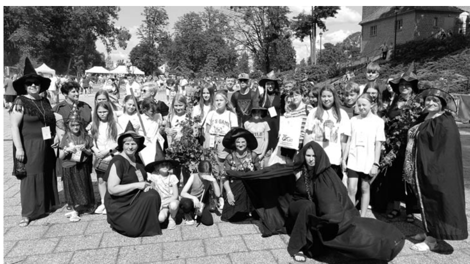
Gra miejska „Czarodziej w świecie Mugoli”