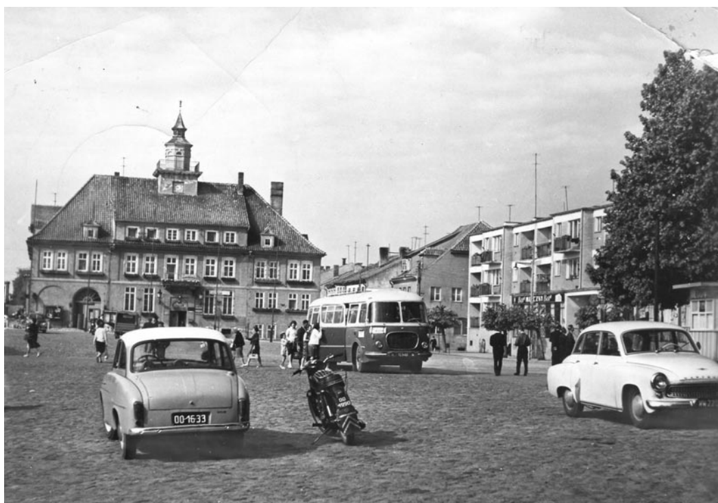
Rynek w Olsztynku lata 60-te

Sytuacja w rolnictwie nadal była trudna, ale stopniowo ulegała poprawie. Jan kupił silnik spalinowy, podłączył sieć energetyczną do stodoły, obory i chlewika. Dzięki temu można było korzystać z oświetlenia elektrycznego oraz z różnych urządzeń mechanicznych. W domu pojawiła się pralka „Frانيا”, elektryczne żelazko do prasowa-