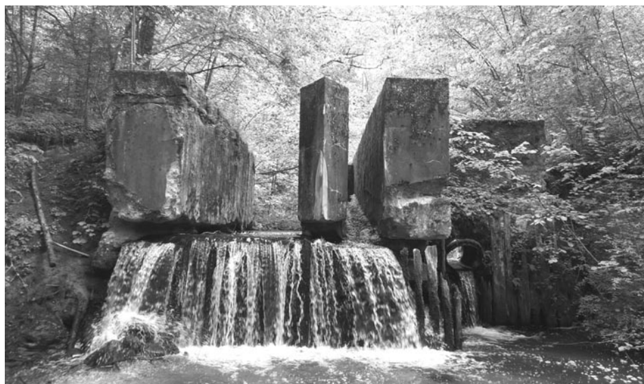
Zapora wodna w Malinowie

Istnieje także inna teoria, która sugeruje zupełnie inne przeznaczenie tej budowli. Otóż w pewnej części tamy wychodzi z niej rura o dużym przekroju, która odbija w lewo w las w kierunku budynków, które znajdowały się około 250 metrów dalej w bezpośrednim sąsiedztwie linii kolejowej. Tuż przed torami znajdował się młyn i tartak oraz najprawdopodobniej także elektrownia wodna. Być może woda odprowadzana tą rurą służyła do wzmocnienia siły strumienia wody, która miała napędzać maszyny pracujące w młynie i tartaku.