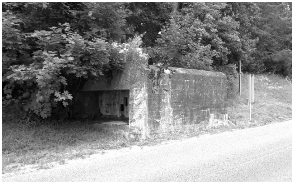
Bunkier bojowy Pak 53 przy drodze do Mielna

walca) wzmocnionymi blachą falistą. Wąskie przejście między nimi wskazuje na to, że druga komora przeznaczona była na skład uzbrojenia, amunicji, prowiantu lub innych materiałów. W tej komorze znajdowało się również wyjście awaryjne. Mają one, podobnie jak schrony bojowe, specyficzne maskowanie ścian nieregularnym betonowym obrzutem.