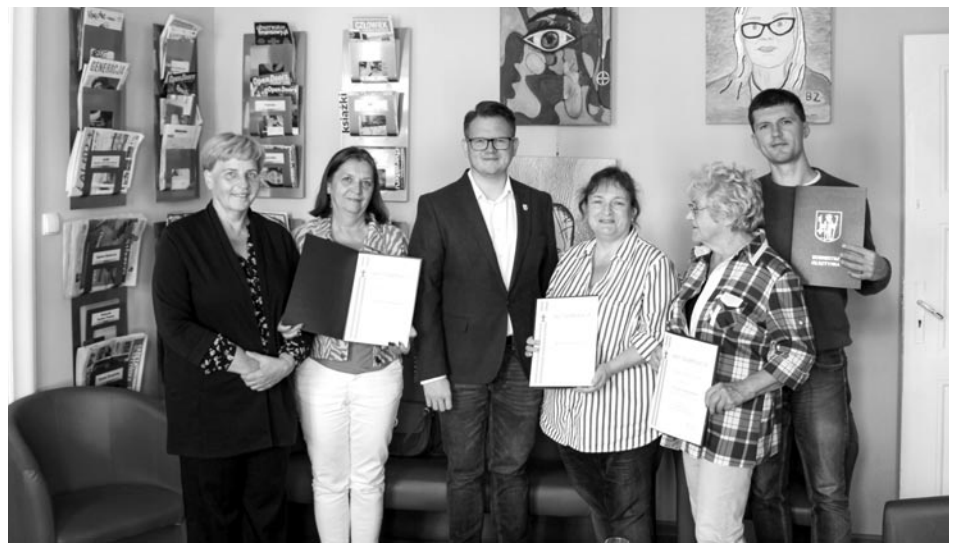
Powołanie nowej Rady Bibliotecznej