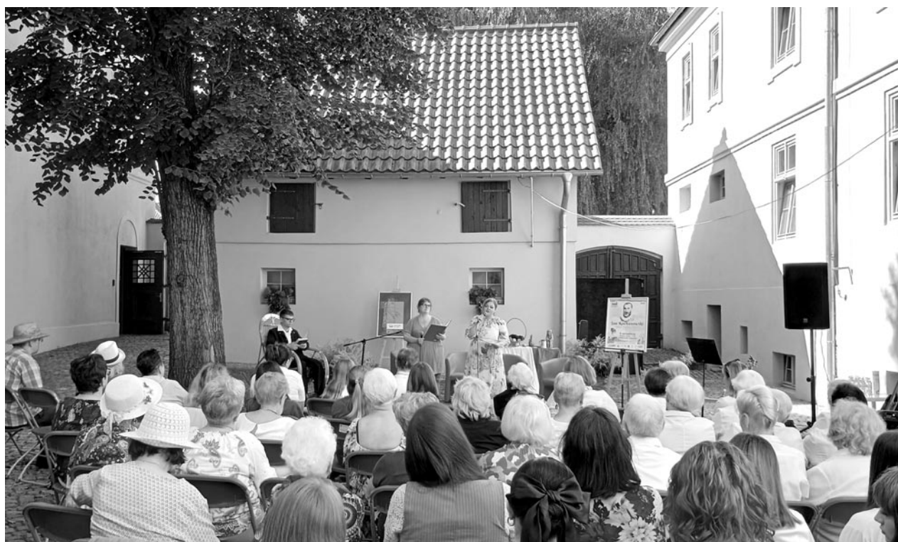
Narodowe Czytanie poezji Jana Kochanowskiego odbyło się na dziedzińcu ratusza