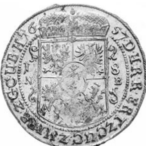
■ Prusy Książęce. Fryderyk Wilhelm 1640-1688, Ort 1657, Królewiec

protestowano przeciw poczynaniom elektora i jego namiestnika. Opozycja skupiała się w Królewcu. Jej trzon stanowili mieszczenie królewieccy, świadomi swej roli w życiu stanowym i gospodarczym Księstwa. W 1658 roku urzędnicy elektorscy rozlepili na murach miejskich, kościelnych i budynkach urzędów osobliwy dokument. Był to manifest oznajmiający, że król Polski Jan Kazimierz uznaje suwerenność elektora w Prusach Książęcych i zwalnia ludność od przysięgi lennej, dotychczas składanej na wierność królowi i Rzeczypospolitej. Wiosną 1660 roku wpływały, pochodzący ze znakomitego rodu szlachcic Wal-