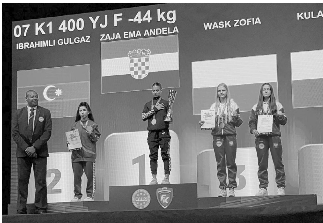
Mistrzostwa Europy Woko Youth European Kickboxing Championship Italy 2025

Jak bywa na takich turniejach, nie ma tam słabych przeciwników i łatwych walk. A już sama lista zgłoszonych zawodniczek robiła wrażenie. Bo oprócz Zosi w jej kategorii zgłoszone zostały aktualna mistrzyni Świata w Full Contact, 1-ka światowego rankingu WAKO w formule lowkick, zdobywczyni srebrnego medalu na Pucharze świata etc. Losowanie trochę nie poszło po naszej myśli, bo już w półfinale mogliśmy trafić na najmocniejszą rywalkę, jaką była Chorwatka – aktualna mistrzyni Świata. Po ówczes-