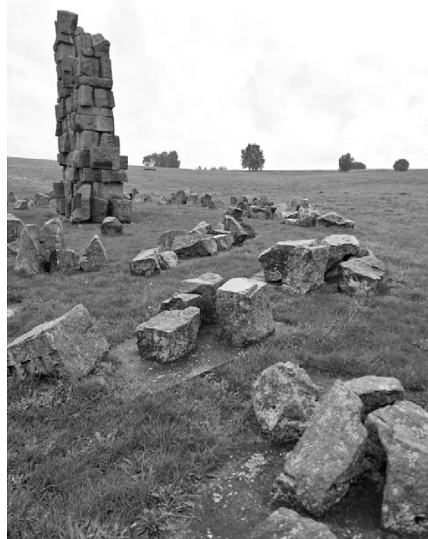
Granitowe bloki z oryginalnego pomnika na polach grunwaldzkich