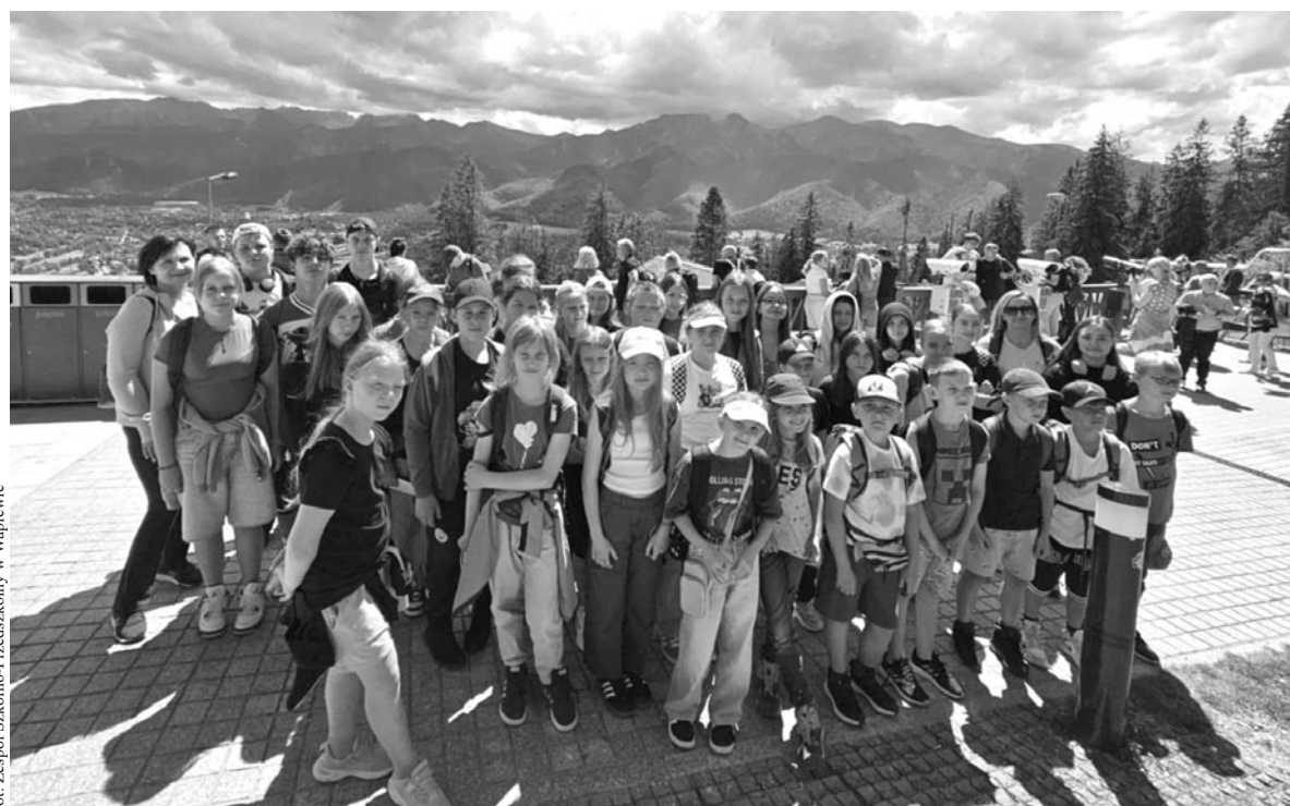
fol. Zespół Szkolno-Przedszkolny w Waplewie