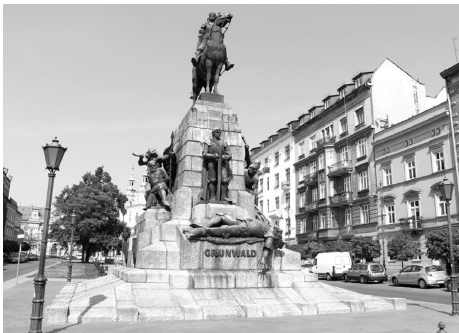
Pomnik Grunwaldzki obecnie