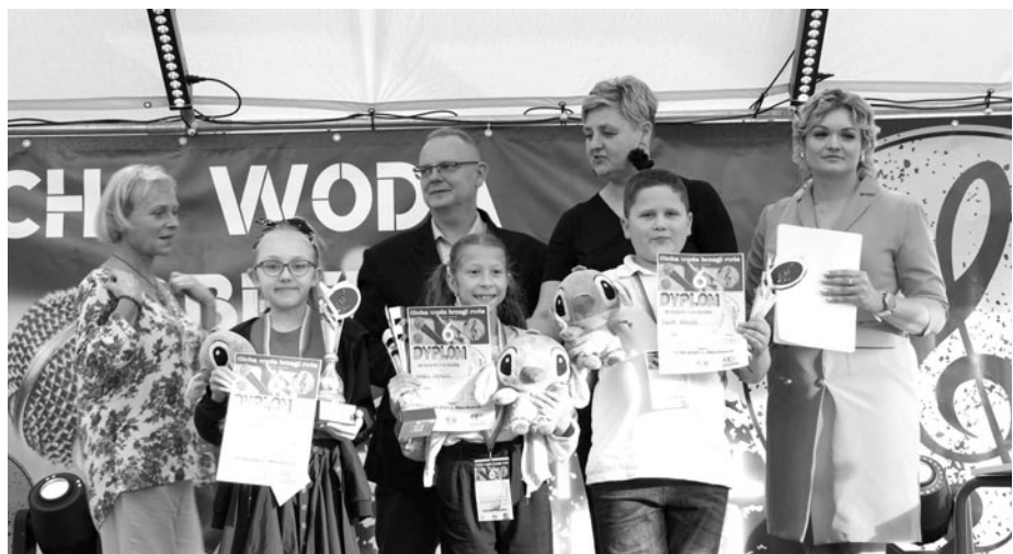
Festiwal „Cicha Woda” (Sławkowo)