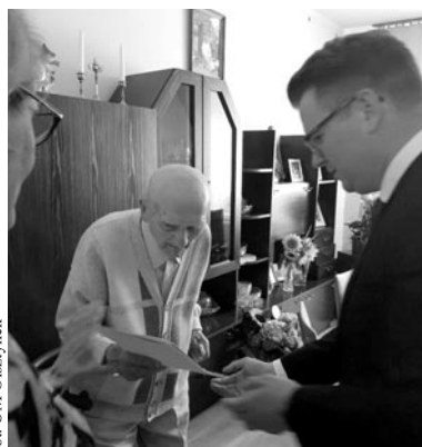
fol. UM Olsztyniek