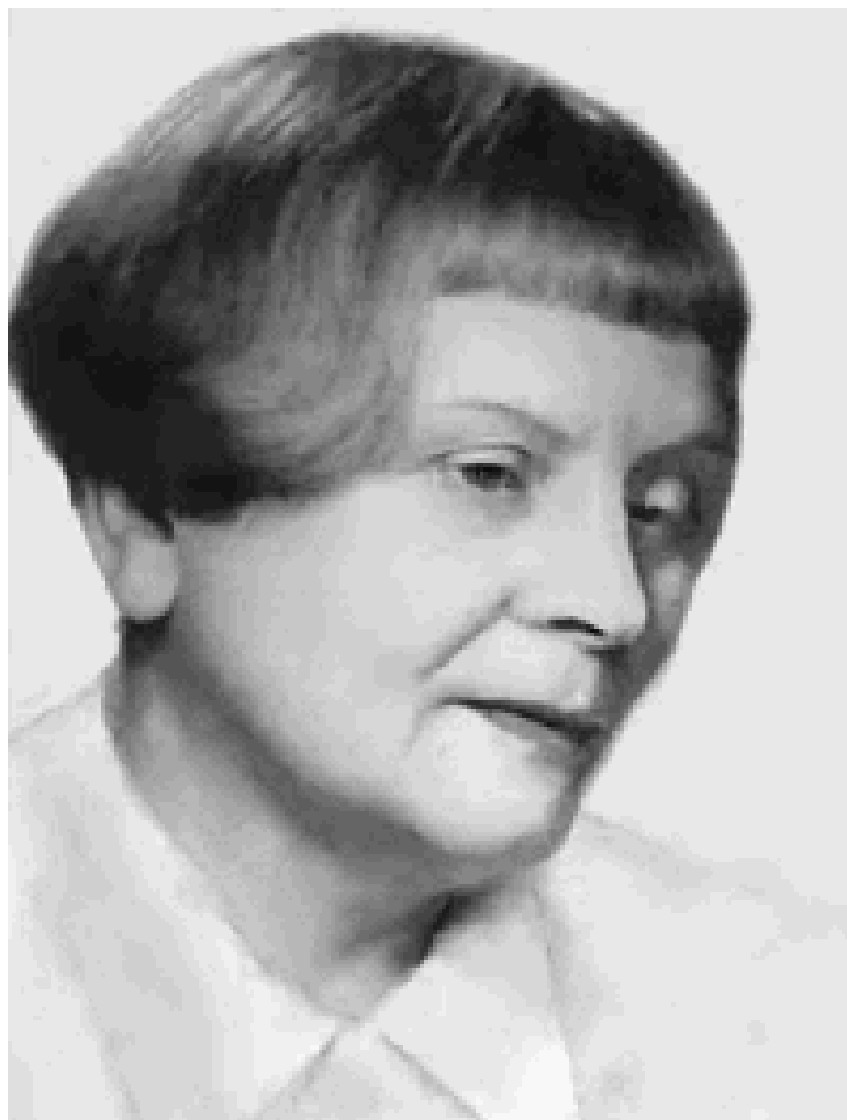
Maria Dąbrowska

Maria Dąbrowska urodziła się w Russowie pod Kaliszem. Jej rodzice, podobnie jak bohaterowie „Nocy i dni”, Barbara i Bogumił, pochodzili ze zubożałej szlachty. Powieściowy Kaliniec, to odwzorowany Kalisz. Bogumił i Barbara, główni bohaterowie powieści, wzorowani byli na administratorach majątku w Płonnem. Wątek Agnieszki Niechcicówny i działacza socjalistycznego Marcina Śniado-