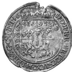
■ Prusy, Fryderyk Wilhelm, Ort Królewiec 1651 - littery CM