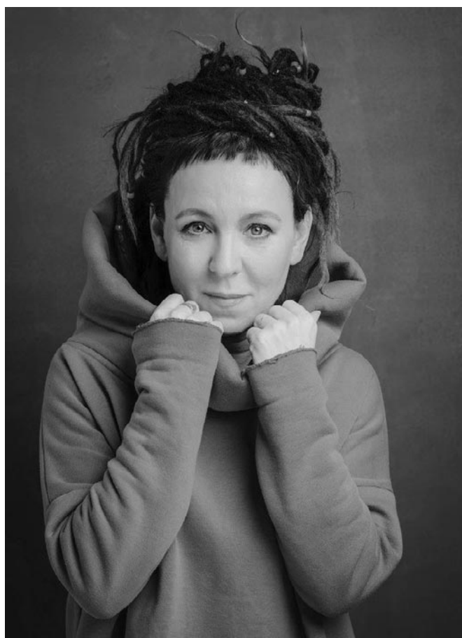
Olga Tokarczuk

Szczególne uznanie przyniosły jej kolejne powieści „Bieguni” (2007), za których angielskie tłumaczenie („Flights”) otrzymała w 2018 roku