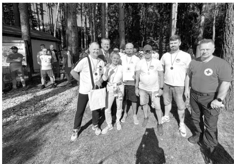
fort. Klub HDK Elgnówko

Przykładowe zapotrzebowanie na krew: proste zabiegi - około 2 jednostek krwi, operacje serca - około 6 jednostek krwi, przeszczepienie wątroby - około 20 jednostek krwi, pacjenci onkologiczni - tygodniowo potrzebują około 3 jednostek krwi, ofiary wypadków drogowych - mogą wymagać nawet 10-12 jednostek krwi, najtrudniejsze przypadki - jeden pacjent może potrzebować nawet 50 jednostek krwi. Każdy sam może sobie przeliczyć, ile dzięki naszym akcjom możemy uratować ludzkich żyć. Podczas akcji była prowadzona zbiórka pieniędzy na wsparcie działań Grupy Ratownictwa PCK Olsztyn. Zebraną kwotę 600 zł wpłaciliśmy na konto Grupy. Wcześniej już przekazaliśmy 1000 zł z zasobów finan-