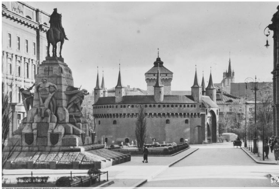
Postać oracza, która pojawiła się na pomniku w 1912 r.

tutaj znajdował się Wawel z grobami królów, tutaj przechowywano najważniejsze pamiątki narodowe, a w oczach Polaków miasto pełniło rolę „polskiej stolicy” pod zaborami,