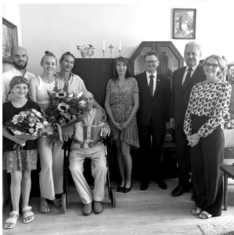
fol. UM Olsztyniek