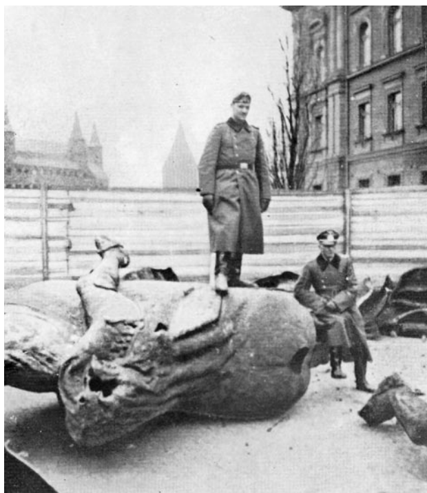
Zniszczenie pomnika przez Niemców w listopadzie 1939 r.

Uroczystości jubileuszowe - zwane „Triduum Grunwaldzkim” - odbywały się w dniach 15-17 lipca 1910 roku w Krakowie. Wydarze-