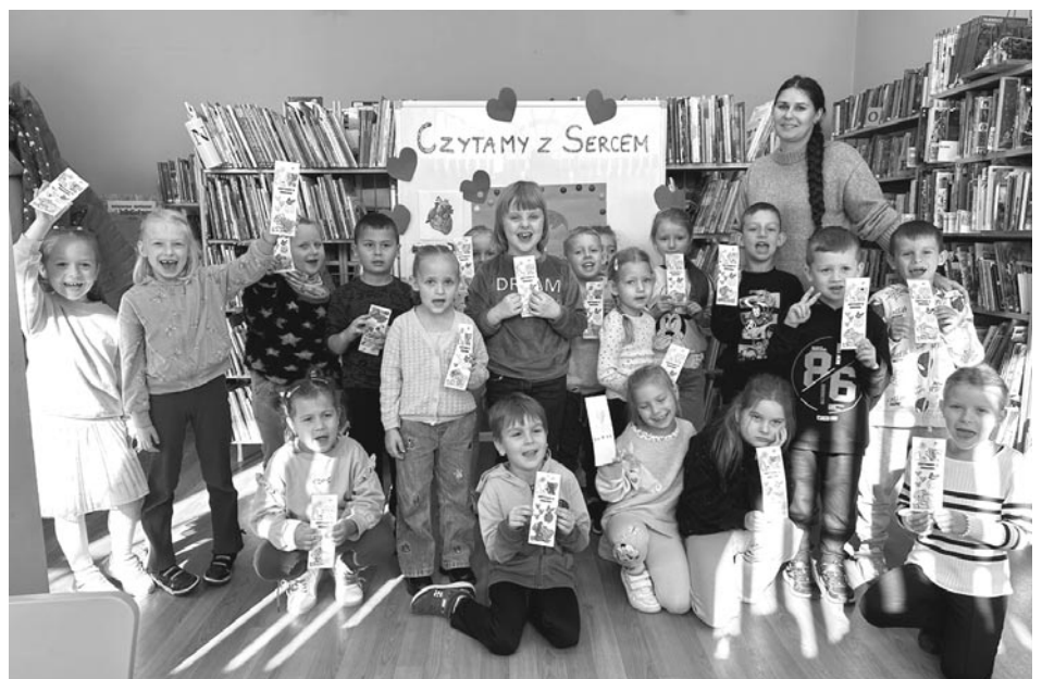
Akcja „Czytanie z sercem”

być nie tylko źródłem wiedzy i rozrywki, ale również inspiracją do dbania o siebie i innych.