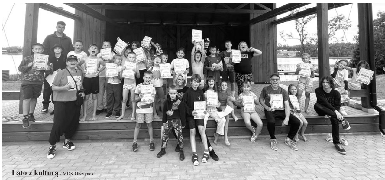
Lato z kulturą / MDK Olsztynek

4–8 sierpnia – Cykl pięciu dni spotkań dla dzieci. Zajęcia pełne atrakcji, roz-