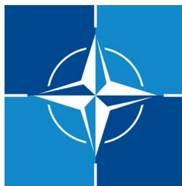
Biały pierścień symbolizuje jedność, róża kompasowa dążenie do zapewnienia bezpieczeństwa ze wszystkich stron

10 lat zabrało uznanie, że to są zadania w dużej części niewojskowe i że ich rzetelne wykonanie wymaga pieniędzy z budżetów narodowych oraz lokalnej aktywności. W końcu, plany odpornościowe doczekały się jednak solidnego finansowania dzięki naciskom Prezydenta Trumpa i talentom dyplomatycznym Marka Rutte, Sekretarza Generalnego NATO! Przyjęty w Hadze podział wydatków zbrojeniowych na 2 kategorie: 3,5 proc. PKB na armię; 1,5 proc PKB na cele związane z obronnością i odpornością cy-