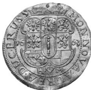
■ Niemcy, Brandenburgia-Prusy, Fryderyk Wilhelm (Wielki Elektor), dukat 1663 HM, Królewiec