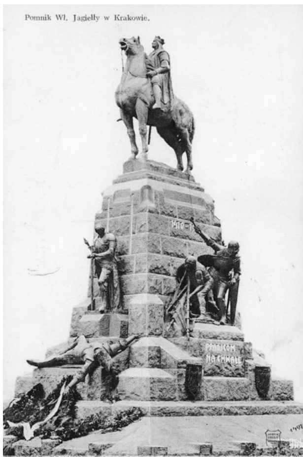
Pomnik Grunwaldzki, pl. Jana Matejki, Kraków, 1910 r.