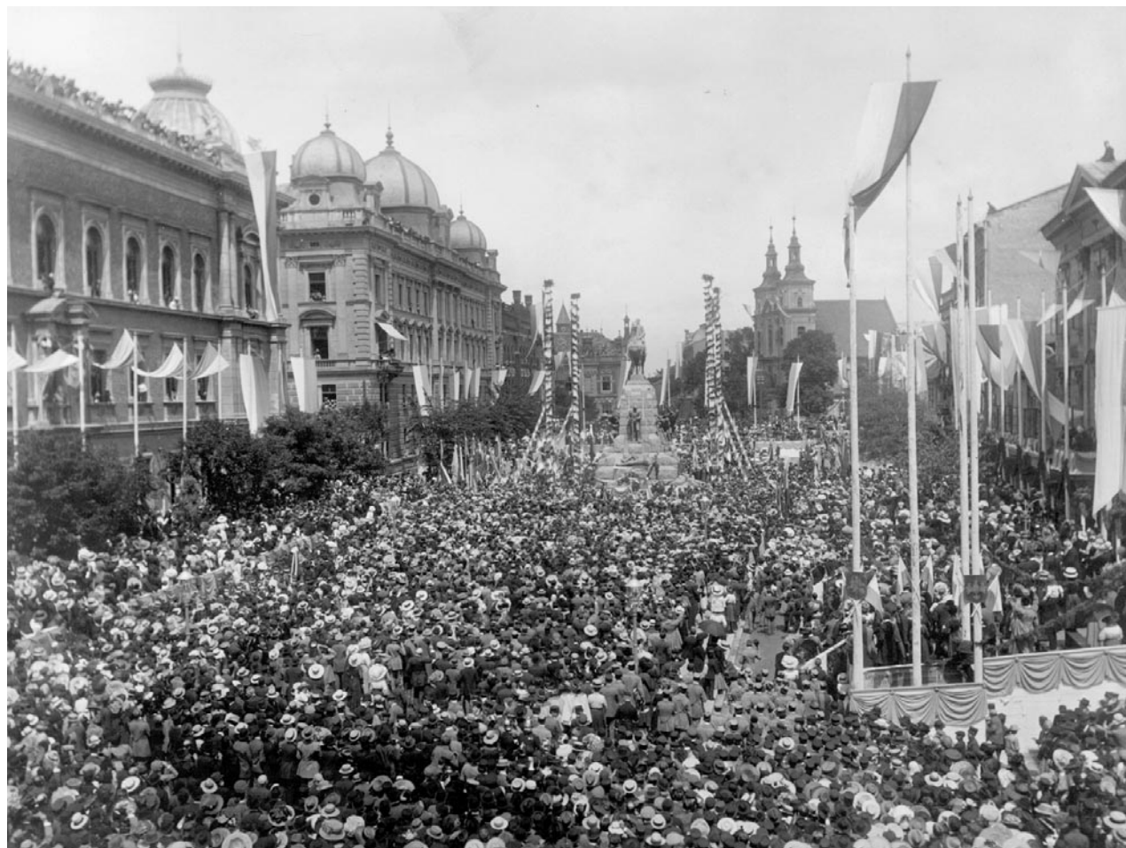
Uroczystość odsłonięcia Pomnika Grunwaldzkiego dnia 15 lipca 1910 r.

gdy Litwa oficjalnie przyjęła chrześcijaństwo, argument ten stał się nieaktualny. Zakon zaczął więc sięgać po inne środki – prowokacje polityczne, najazdy, a także propagandę, przedstawiając Litwę jako kraj nawrócony „niedostatecznie”. Spornym punktem była również Żmudź – region istotny strategicznie, łączący Litwę z Bałtykiem, o który toczyły się liczne walki. Wreszcie spory handlowe i gospodarcze, jak kontrola nad szlakami handlowymi, pogłębiały konflikt. Na początku 1410 roku Władysław Jagiełło i wielki książę litewski Witold podjęli decyzję o wspólnej ofensywie. Siły sprzymierzone były imponujące: obok rycerstwa polskiego i litewskiego w armii znalazły się oddziały tatarskie, ruskie, a nawet ochotnicy z Czech i Moraw. Marsz wojsk polsko-litewskich przez ziemie zakonne