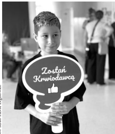
fort. Klub HDK Elgnówko

13 września zorganizowaliśmy kolejną, cykliczną akcję poboru krwi. Wzięły w niej udział 32 osoby. Od 30 osób pobrano krew – łącznie oddano 13,5 l czyli 30 jednostek krwi.