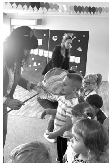
fort. Przedszkole Miejskie w Olsztynku

W naszym przedszkolu tradycją stało się wielkie pasowanie na przedszkolaka naszych najmłod-