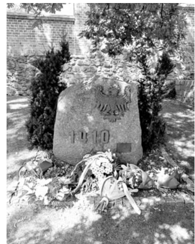
fol. UM Olsztyniek