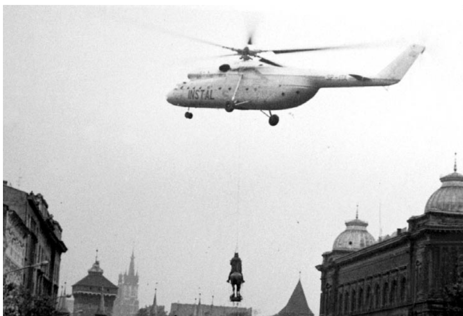
Transport nowej figury Jagiełły na odbudowany pomnik - rok 1976